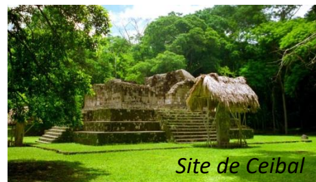
Site de Ceibal

Visite du site. Ici les stèles sont parmi les plus belles de l'art maya.