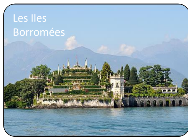
Les Iles Borromées

Pour plus d'informations, contacter Nicole PELOT au 06 83 02 38 91