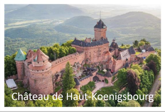
Château de Haut-Koenigsbourg

Départ du parking Palais des Sports de Dijon aux environs de 7h15. Arrêt et visite guidée de Eguisheim, l'un des plus beaux et typiques villages d'Alsace. Le midi, repas tiré du sac. Puis poursuite de notre route jusqu'à Orschwiller pour la visite guidée du château de Haut-Koenigsbourg. Erigé au 12e siècle, ce château a été pendant des siècles le témoin de conflits et de rivalités entre seigneurs, rois et empereurs. Reprise du trajet et embarquement à Strasbourg à 18h00. Présentation de l'équipage et cocktail de bienvenue. Visite nocturne de Strasbourg en bateau-mouche.