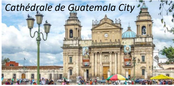
Cathédrale de Guatemala City

Petit-déjeuner puis continuation vers Guatemala City . Visite du centre historique et ses principaux monuments : le Palais National, une des plus belles réalisations architecturales du Pays et la Cathédrale érigée au 18ème siècle.