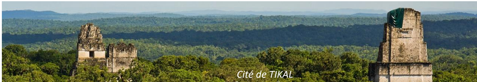
Cité de TIKAL

Petit-déjeuner puis journée dans la prodigieuse cité de TIKAL, déclarée patrimoine mondial par l'Unesco et plus grande ville maya découverte à ce jour. Le site couvre 170 km 2 et 10 000 structures. Une dense forêt tropicale sépare les nombreuses plazas.