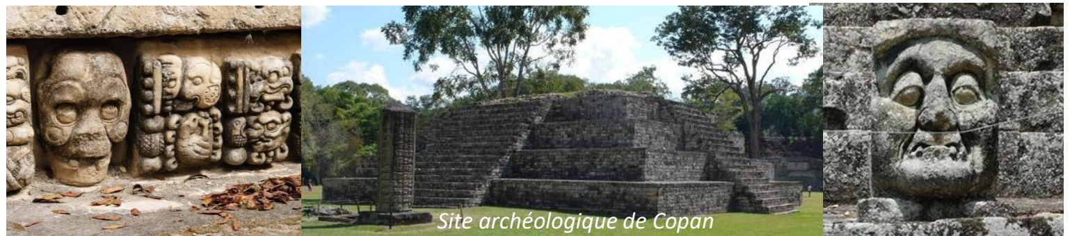
Site archéologique de Copan

Petit-déjeuner puis départ par la route à destination de la frontière du Honduras. Passage de la frontière. Poursuite de route pour Copan. Déjeuner de spécialités honduriennes.