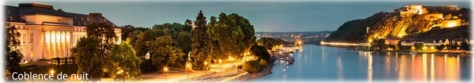
Coblence de nuit

Journée en navigation vers Coblence sur la plus belle partie du Rhin romantique. Visite guidée de Coblence, puis escapade en téléphérique pour rejoindre la forteresse d'Ehrenbreitstein, d'où vous aurez une magnifique vue sur la ville, le Rhin et la Moselle. Surplombant l'embouchure de la Moselle, la forteresse domine la vallée du Rhin à un emplacement d'une grande importance stratégique. Retour à bord en téléphérique.