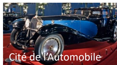
Cité de l'Automobile