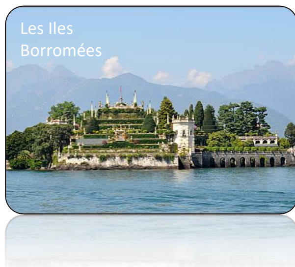
Les Iles Borromées

Pour plus d'informations, contacter Nicole PELOT au 06 83 02 38 91